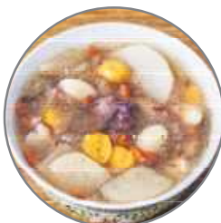
雪梨汤内也可以加入银杏或其它食材。