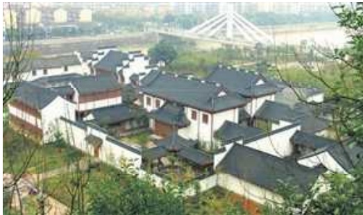
西施故里的四合院

四合院的基本构成包括一个中心庭院与四周房屋，通常采用坐北朝南的布局，以获得良好的采光与通风条件。北侧为正房，地位最高，常建于略高的台基之上，是家庭中长辈或一家之主的居所，同时也承担会客、