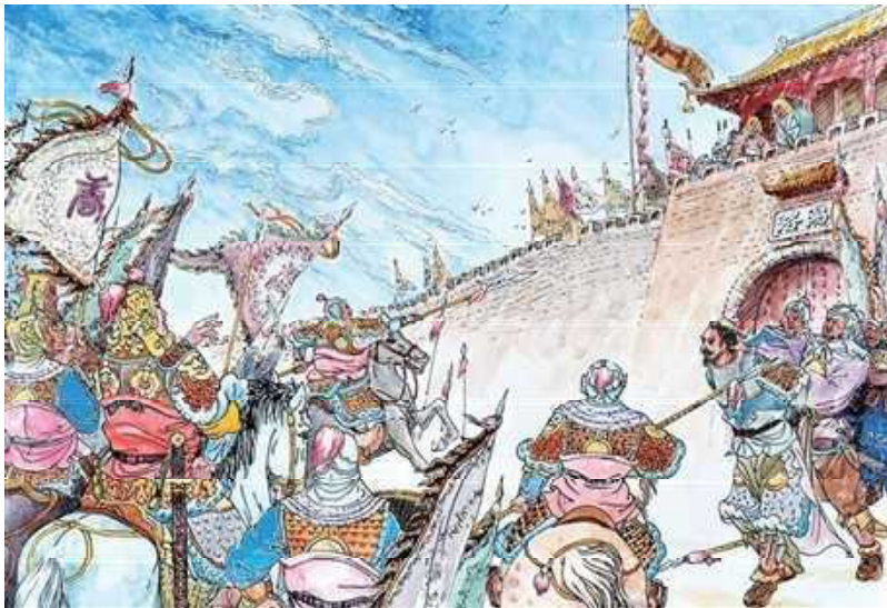
世民押着窦建德到洛阳城下，王世充在城上看到窦建德被捆绑着押来，顿觉五雷轰顶，最后的希望彻底破灭了！(绘图/曹醉梦)

李世民只带了3500骑兵进驻武牢。一天，世民率500精骑观窦建德军营，自己只留四人，与尉迟敬德一同前往敌营。余者由李世绩、程知节、秦叔宝统领，埋伏在道路两旁。李世民边走边对尉迟敬德说：“我持弓，你用槊，纵使敌军百万，又奈我何？”进入窦建德军营后，秦王大呼：“秦王世民到了！”窦军冲出五千多骑追赶世民，世民的四个随从已吓得面无人色，世民让他们先走，自己与尉迟敬德殿后，不紧不慢地把敌军引入唐军埋伏圈。李世绩、秦叔宝、程知节一跃而起，奋力冲杀，夏军大败。