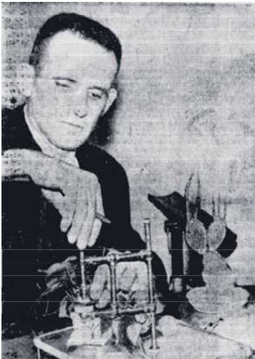
克里夫·巴克斯特 (Cleve Backster) 用测谎仪测试植物。(公有领域)

时发出感慨道：“当时电极连着一片叶子。我的脑海里突然闪出了用火烧它的叶子的念头。这念头刚一出来，指标立即做出了剧烈的反应，一下子摆到了图表的顶端。天哪！它竟然知道我在想什么。我立刻意识到植物也是有意识的。”