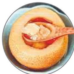
雪梨也可采用炖梨盅的做法，把整个梨掏空，当作“天然容器”来蒸。