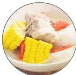
山药排骨汤里也可以适当加入玉米、胡萝卜、葱花等食材以增加滋味。

山药的黏液质地能在喉咙形成一层柔软的保护层，减轻刺激。三者的组合让汤汁浓而不腻，喝完有一种“暖进肺里”的满足感。