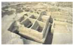
梅尔加尔遗址 (Mehrgarh)

2006年，考古学家在位于现今巴基斯坦境内的梅尔加尔遗址，发现了一批距今约9000至7500年的墓地遗骸，其中有数颗牙齿显示出明显的人工钻孔的痕迹。这些孔洞并非自然损伤，而是经过刻意加工形成。外界普遍认为这是目前已知最早的牙科手术之一。