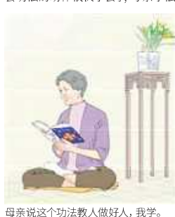
母亲说这个功法教人做好人，我学。

母亲没有上过学，在扫盲班学过一些字，但学功就要看法轮功著作《转法轮》，这对六十岁的母亲来说有不少困难，可是看到法轮功教人做好人，就对《转法轮》爱不释手。五套功法的动作很快学会了，母亲学法