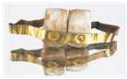
意大利的伊特鲁里亚人从公元前700年起就制作假牙，他们将其他人或动物的牙齿镶嵌在带有金属箍的金箍上，然后固定在剩余的牙齿上。

研究发现，当时的人们会使用天然黏合剂在牙上固定宝石。这些镶嵌物在出土时仍牢固附着，显示出相当成熟的工艺水平。更令人惊讶的是，这些操作是在不损伤牙髓的情况下完成的，意味着当时的操作者对