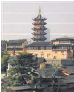
同泰寺（今称鸡鸣寺）

由于帝王的以身事佛，南朝佛教至梁达到了顶峰，上至帝王宗室，下至世家大族、平民百姓都崇信佛事，佛教乃成为国教，兴盛空前。