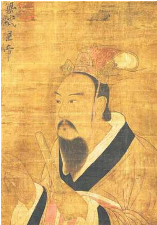
梁武帝萧衍

明。萧衍还下诏书到全国，如果有小的县令政绩突出，可以升迁到大县里做县令。大县令有政绩就提拔到郡做太守。政令执行起来后，南梁的官治状况得到显著改善。