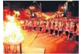
彝族的火把节，当地称为“过大年”。

每年农历6月24日是本地彝族的传统火把节，当地称为“过大年”。作为彝家人一年中最重要的日子，彝族阿哥和阿妹们身着盛装，载歌载舞庆祝节日的到来，并在聚落间举行斗羊、斗鸡、斗雀、高索秋四项传统山地体育比拼，延续古老的山地原住民的文化传统。