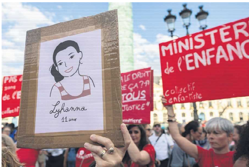
2026年6月29日，在巴黎旺多姆广场的法国司法部大楼前，人们举着标语，参加悼念莉安娜的抗议活动。

“正如各位所知，司法的本质和司法的基本原则，就是寻求真相。这正是我们在日常处理案件时所做的工作。当然，这种对真相的追求同样适用。此外，这也是我们的日常工作。我们采用对抗式审理方式。我们所做的一切都要接受当事双方的质证，并在法官面前进行说明和辩论。而在这寻求真相的过程中，也必须涉及组织层面的问题。本案中是否存在失职行为？检查组将查明事实，并指出