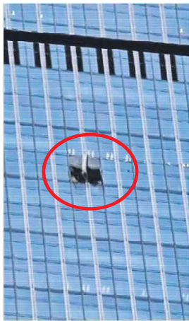
2026年6月26日，一架小飞机撞北京中信大厦，残骸散落一地。

根据公司内部记录，这架飞机当天执行的只是一项极其平常的“本场空域单飞训练”。按照常规，学员