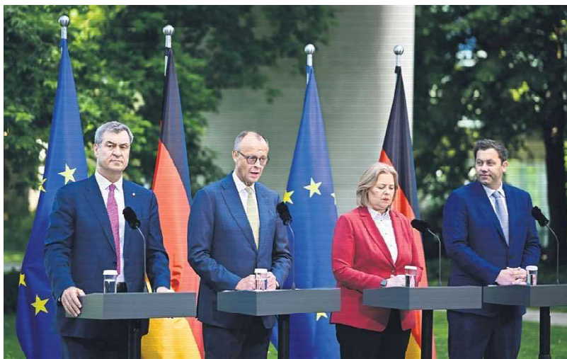
7月2日，德国总理（左二）等四位领导人出席发布会并讲话。

整体来看，此次税收改革预计每年可减轻纳税人约100亿欧元的税负。不过，政府也必须解决减税带来的财政缺口。根据改革方案，高收入群体未来可能承担更多税负，包括提高所谓的“富人税”。此外，Minijob（低收入兼职）的统一税率也计划从目前的2%提高至5%。