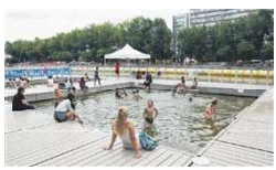
巴黎19区维莱特港池的泳区

巴黎4区的玛丽支流泳区 (Bras Marie)、15区的格勒内勒支流泳区 (Bras de Grenelle) 以及12区的贝西码头泳区 (Quai de Bercy)。为确保安全，相关部门将每日对水质进行实验室采样检测。