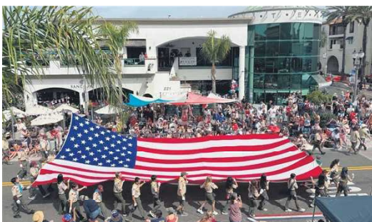
7月4日，加州橙县杭廷顿海滩市举行美国250周年独立日游行。

其社交媒体上发布了法国空军特技飞行队在自由女神像上空飞行的照片。英国外交部在社交媒体上发布了带有美国国旗的“1776”和“2026”字样，称美国为“最亲密的盟友”。