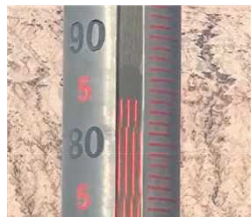
2026年7月2日，新疆火焰山景区地表温度飙升至84度。(视频截图)

【记者李木子综合报导】中国大陆多地高温破纪录，新疆吐鲁番近日也开启“烘烤模式”，火焰山景区地表温度飙升至84°C，刷新今年入夏以来当地地表温度最高纪录，直逼历史极值89°C。