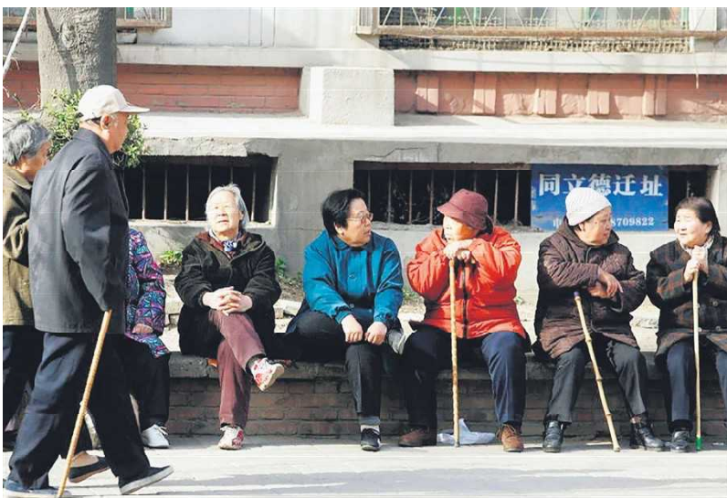
中国老人

国家统计局数据显示，2024年中国康养旅居消费规模已突破2万亿元，占整个银发经济的近五分之一，增速显著跑赢传统旅游业。每逢季节更替，数以百万计的“候鸟老人”涌入海南、广西等地，直接带动了当地餐饮、医疗乃至地产的消费。大型保利、泰康等金融保险巨头以及万科等房企，也纷纷将闲置物业改建为康养社区，竞相涌入这片尚待开发的产业。