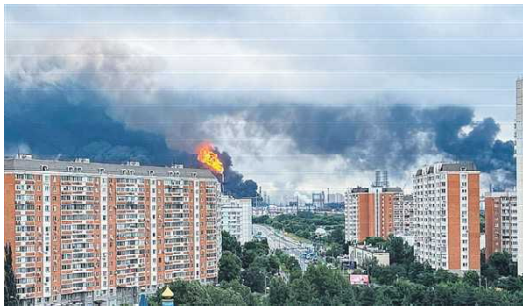
2026年6月18日，莫斯科东南郊，俄罗斯石油生产商俄罗斯天然气工业石油公司 (Gazprom Neft) 旗下莫斯科炼油厂上空升起滚滚黑烟。(AFP/Getty Images)

俄罗斯总统普京 (Vladimir Putin) 在6月28日承认燃料短缺问题的存在，并承诺将采取措施稳定市