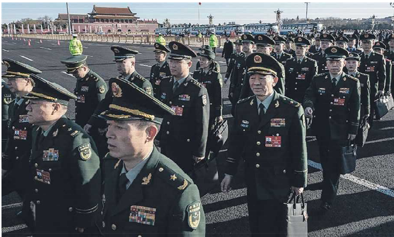
军方代表们去北京参加会议。

值得注意的是，习近平在4月8日开班式讲话中，再次把反腐与政治忠诚紧密联系起来，多次提到“整风”、“政治整训”、“思想统一”，并强调军队“绝不能有对党怀有二心之人”。外界认为，这番表态不仅延续了近年来军队持续整肃的基调，也说明这场培训已超出一般业务学习，更像是一场针对高级将领的政治整训。