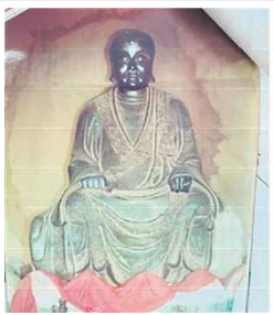
海口五公祠被盗文物 (网页截图)

北京主馆常年举办以传世文物为主的专题展览，设有陶瓷馆、家具馆、工艺品、门窗馆等，在文玩收藏界与公众眼中具有极高的知名度与行业分量。