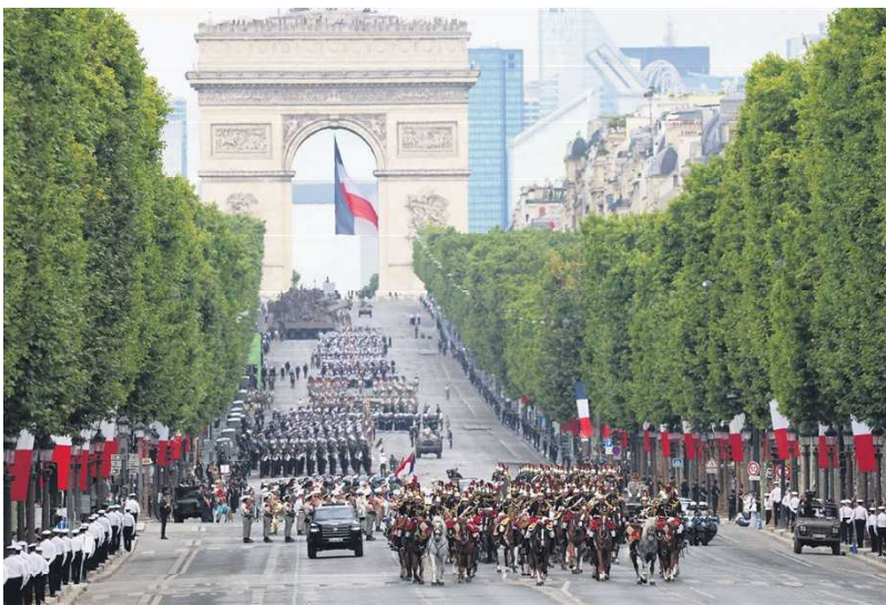
2025年法国国庆阅兵式

除了传统方阵和装备,今年阅兵还首次采用全新方式,以更具科普性的编排,展示现代战场的作战形态。此举突出了武装部队的层级结构与