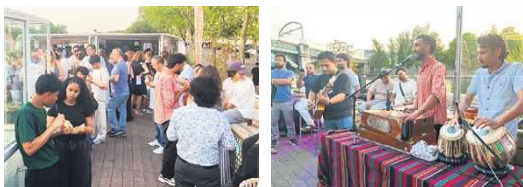
6月23日，ASLC语言协会举行了30周年庆典。

作是源于那时我看到巴黎有很多中国音乐家，但他们大多在餐馆打工或从事艰苦的职业，让我觉得很可惜。所以我们就组建了一个乐队。我们开始各地演出，因为中国人爱在路上吃零食，所以每次外出时马克都会说‘别忘了带些花生’。