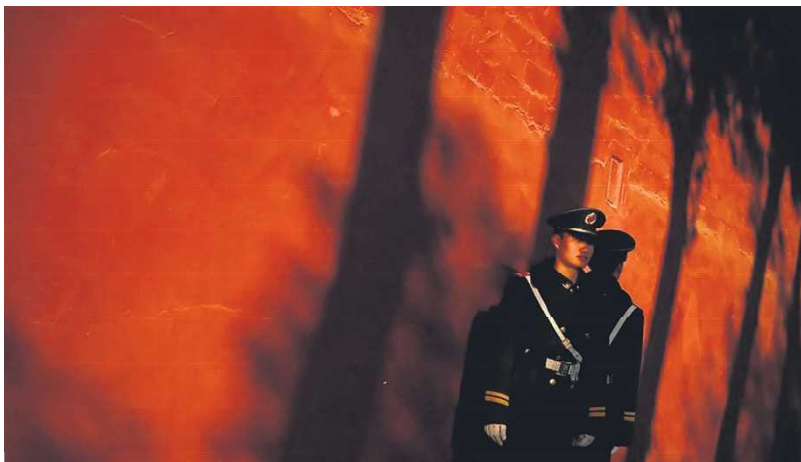
北京红墙

上述情况表明：王小洪很可能遇到了什么麻烦。一种可能是，他的身体确实患有某种疾病；另一种可能是，他在政治上遇到了“坎”。