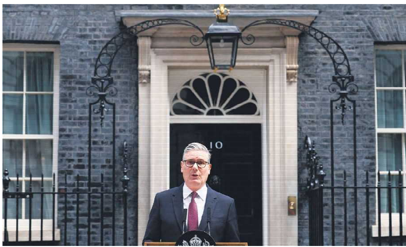
2026年6月22日上午，英国首相基尔·斯塔默在伦敦唐宁街10号外宣布辞职，结束了不到两年的任期。

在2024年大选中带领工党战胜已执政了14年的保守党，其中一个原因是民众对前保守党政府的不满。他以口号“改变”投入2024年大选，并把自己的政治品牌置于竞选核心：稳健、有能力、体现最高的道德标准。