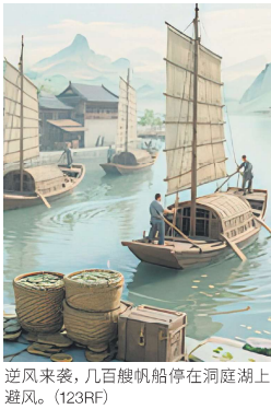
的心情稍微稳定了一些，但船家却惴惴不安，说担心风向会改变，只好勉力加速航行。离开岸不到半里时，风向突然又逆转，且风力越来越猛，再加上船大容易招风，根本无法靠岸。

第二天早上风向转顺，各艘船都不约而同地出发。到了傍晚时，距离湘阴还有十几里，风突然停了，大家