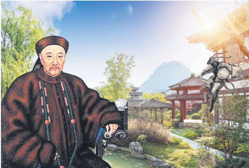
乞丐为生，沦为小偷的他，命运却在数年之间陡然翻转，终成巨富。

众人将某甲与那男子一并送官。官衙审讯时，男子反诬妇人与某甲通奸。某甲坦然道：“我是贼，世人皆知。妇人纵然不贞，岂肯与贼通奸？”为证清白，他甚至将自己过往盗窃之事一一道出。核查无误后，官府严刑逼供，那男子终吐实情——原来他垂涎妇人美色，贿赂老妇引路，欲行不