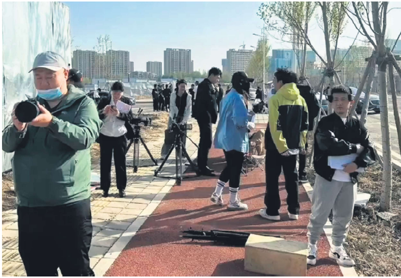
等待电影拍摄的剧组工作人员

“这是一条劝退视频。如果说普通人想要当演员，想要进入演员这个行业，我真的是不建议。因为我曾经在杭州当过两年的素人演员，这个行业如果说你再往上爬的话，真的是越来越不容易啊。”