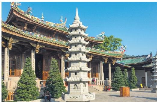
清代文人李庆辰曾记载一位士人的小儿子是其已故岳父转世，小孩后来选择出家修行，以摆脱前世今生颠倒的关系。

轮回转世的记载，在世界各地都有很多。清代文人李庆辰就曾记录过这样一则真实的轮回案例。