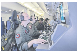
P-8 Poseidon海上巡逻侦察机作舱