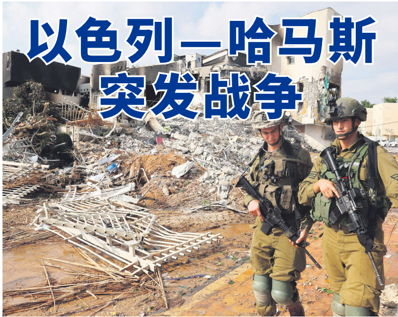
10月8日，以色列士兵站在遭哈马斯武装组织破坏的以色列警察局外面。