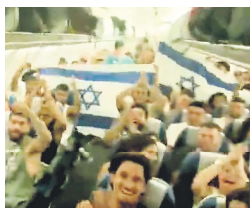
旅居海外的以色列人挤满飞机回国参战。

“国家有难，必须回去战斗”。大批侨居海外的以色列人在8日一早收到家人讯息和新闻推播后，陆续开始准备回国。