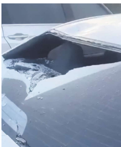
被砸碎的汽车后车窗

过“黑天鹅”事件。2021年9月5日清晨，一只黑天鹅从天而降，落在广场上，引来大批游客和当地市民围观，