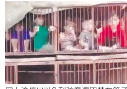
网上流传出以色列孩童遭囚禁在笼子里，被哈马斯当作人质。

然以色列的军事实力远胜于哈马斯，但哈马斯一贯善于利用平民作“人盾”，这也将对以色列的军事行动形成严重掣肘，以色列也会因此面临“难以估量的人员伤亡”。