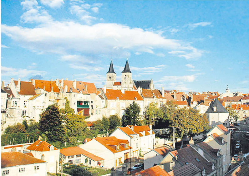
位于上马恩省 (Haute-Marne) 的肖蒙市 (Chaumont)

旗下有700家经纪公司的Laforêt房地产集团的网络总裁杰翰诺 (Yann Jehanno) 立即证实说：“这是我们活动和交易最多的地区。”这个城市的失业率下降 (已经低于法国平均失业率)，上班时间缩短、文化生活丰富、生活成本低廉