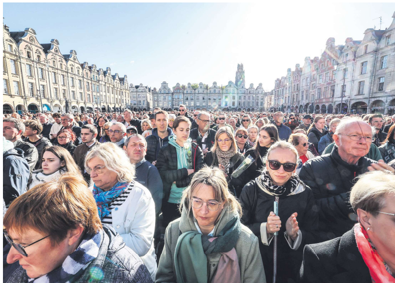
10月15日，人们聚集在法国东北部阿拉斯的英雄广场悼念13日在甘贝塔-卡诺高被恐怖分子刺杀的法语老师。

据悉，穆罕默德出生于俄罗斯高加索车臣地区，20岁。他曾在阿拉斯高中上学，上学时已被登记在防止激进恐怖主义的处理报告档案内，后于去年7月30日被列入威胁法国国家安全的S档案(Fiche S)。