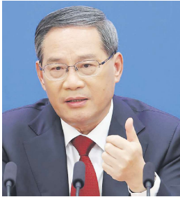
李强 (左) 和蔡奇 (右)

时事评论员李林一分析指出,工会本身和国务院关系密切,其职能第9条明确表示要承担党中央、国务院交办的事项。这么一个重要的会议李强没有出席,释放出一种失势的信号。