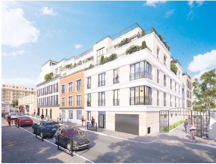
KARACTERE公寓楼位于94省Le Kremlin-Bicêtre市，近地铁7号线和各种便利场所，紧邻巴黎华人区13区。