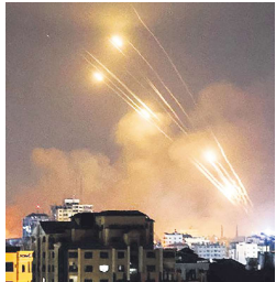
10月7日，巴勒斯坦哈马斯武装组织向以色列发射火箭弹。

10月7日凌晨，巴勒斯坦极端组织哈马斯对以色列发起了大规模攻击。在短短20分钟内，哈马斯向以色列境内发射了5000多枚火箭弹，从海、陆、空三路潜入以色列，在20多个地点发动激战，攻击绑架平民，并宣布这是一次军事攻击行动。此次攻击发生在美国、以色列和沙特阿拉伯进行三方谈判的时候，这三方正讨论可能恢复正常关系和签署停火协议。