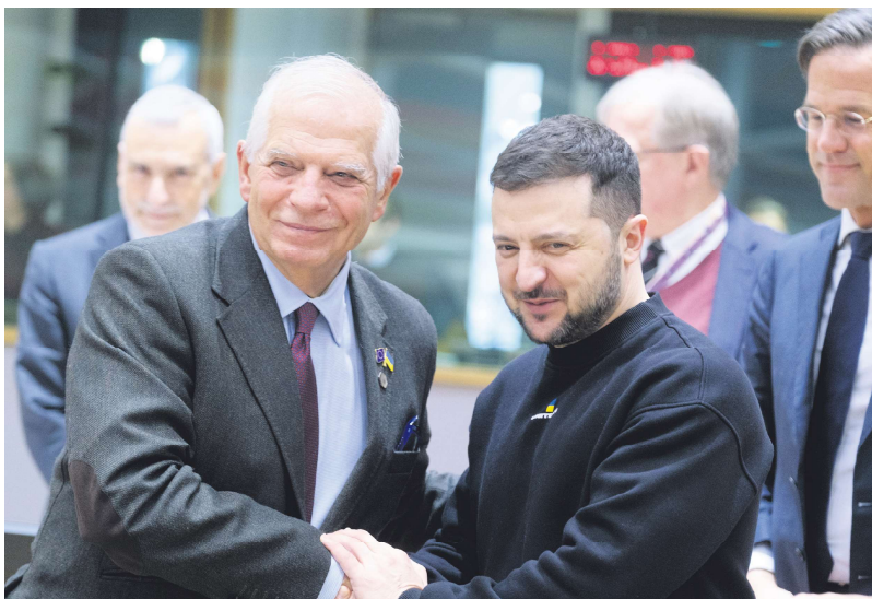
欧盟外交与安全政策高级代表博雷利与乌克兰总统泽连斯基握手。

基担心以巴冲突可能会分散美国这个主要支持者对俄乌战争的注意力，他特别呼吁西方盟友提供防空系统、长程导弹和弹药。