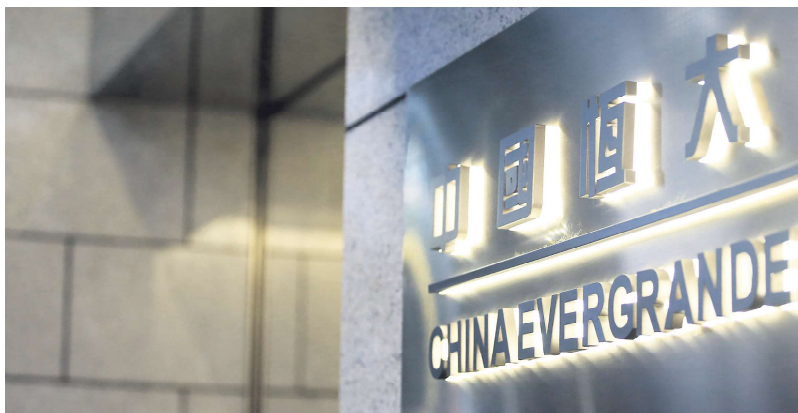
中国恒大

来，投资者及金融消费者十分关注房地产业务对银行资产质量的冲击。一些投资者在互动平台向各家银行发出诘问，对各银行与恒大是否存在债务关联非常关切。对此，多家银行也先后撤清了关系，表示与恒大无业务往来。