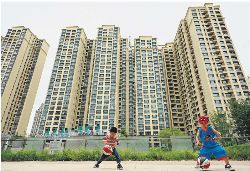
2022年7月28日，孩子们在北京恒大开发的一个住宅区前玩耍。

仅2011年起，许家印就通过分红套现499.81亿。即便在2020年，债务危机苗头已经显现，恒大依然没有停止大手笔分红。