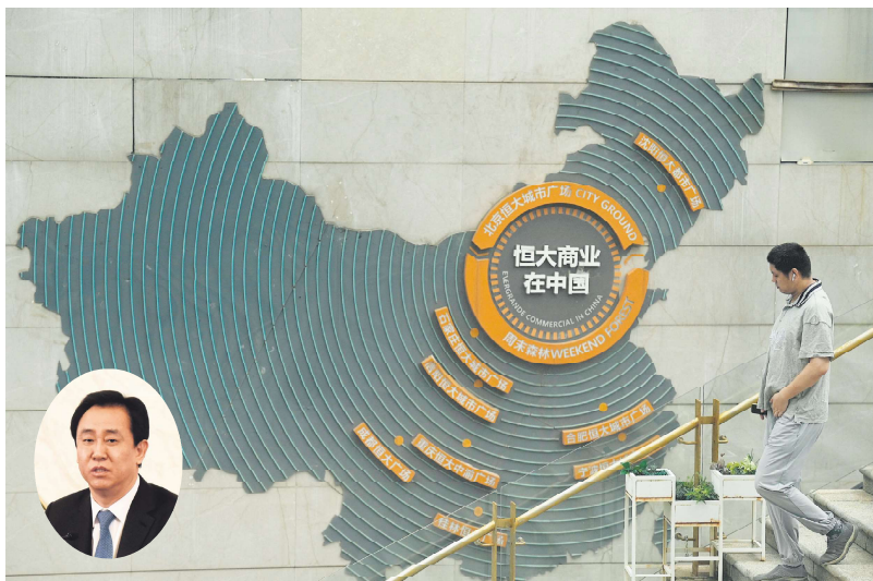
大图：2022年7月28日，中国北京，一名男子走过显示恒大集团在全国各地业务的标牌。 左下图：许家印

到了2021年恒大违约已经公开化了，社会尤其是金融界担心恒大要出大事儿，惠誉评估将恒大系的长期外币发行人评级从“B+”下调至