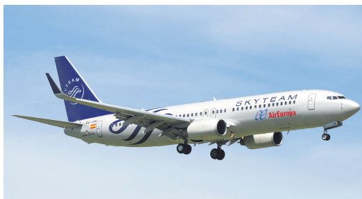
欧罗巴航空的一架波音737-800飞机。

根据欧罗巴航空的通报,黑客窃取的数据仅与银行卡本身相关,并不涉及客户信息。网络犯罪分子不能访问该航空的其它数据库,也未能成功提取客户的其它个人信息。尽管如此,该公司还是向受波及客户发送了电子邮件,建议联系所在银行,注销或更换在欧罗巴航空付款所使用的信用卡,避免信息被非法使