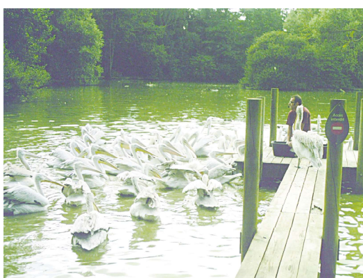
千池之地的安省鸟类公园 (Parc des Oiseaux)

10月7日至11月5日期间，公园今年特别推出的秋季活动有万圣节纹身、乘坐奇异小火车、观看马戏表演和品尝不寻常的蔬菜等活动。