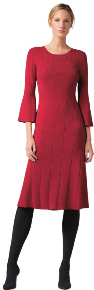
定制的羊毛混纺面料连衣裙 (Gallery Collection)

以纯羊绒为面料，裙身部分采用不对称层叠效果设计。这款BOSS方格连衣裙采用羊毛混纺面料剪裁而成，饰有对比色缎面镶片，腰部饰带纽扣，毛边细节和肩部饰有男装风格的衬垫。这件作品是限量版BOSS女装画廊系列的一部分，是一款以艺术为灵感的独家款式。