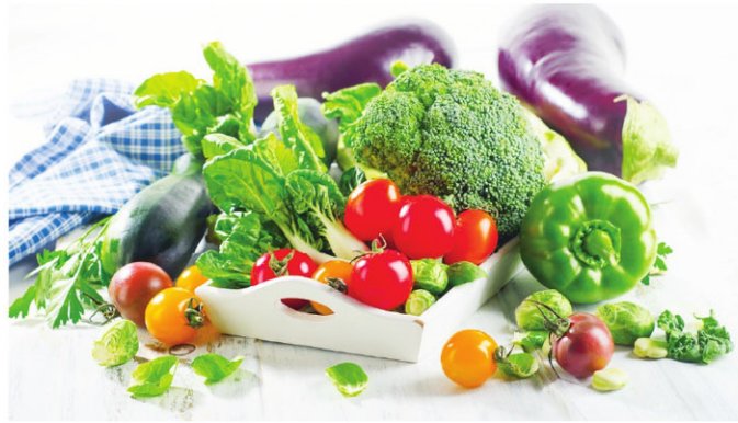
重金属中毒的检测

研究指出，残留在体内时间最长的铅，会加速人体老化，造成贫血、高血压、肾脏疾病，影响儿童智力发展，可能造成儿童过动情形，还可能引起失智和言语障碍等。