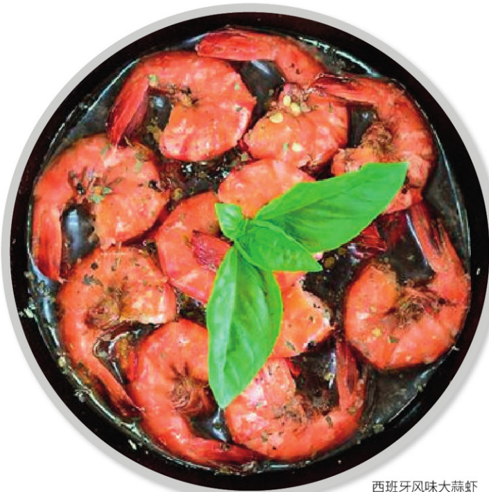
西班牙风味大蒜虾