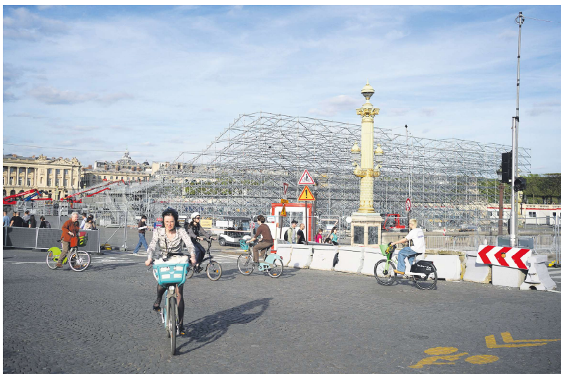
巴黎市中心协和广场上的奥运会工程。

主办方区已从3月开始搭建，将于今年10月拆除。该区域内没有住房、企业或商家，只有获得2024年巴黎奥运会认证或持有门票的人员和车辆才能进入。即使是急救车辆（救护车、消防车、警车或宪兵车）进入该区域也须获得巴黎警察局授权。主办方区域内没有居民、公司或商家。一些主办方区周围会实施停车限制。