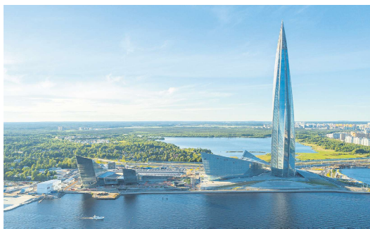
位于圣彼得堡的俄罗斯天然气工业股份公司总部拉赫塔中心

分析师表示，这些损失表明，俄罗斯天然气工业股份公司曾经是“国家冠军”，利用其在欧洲能源供应方面的地位作为地缘政治武器，但未能适应在欧盟市场的损失。