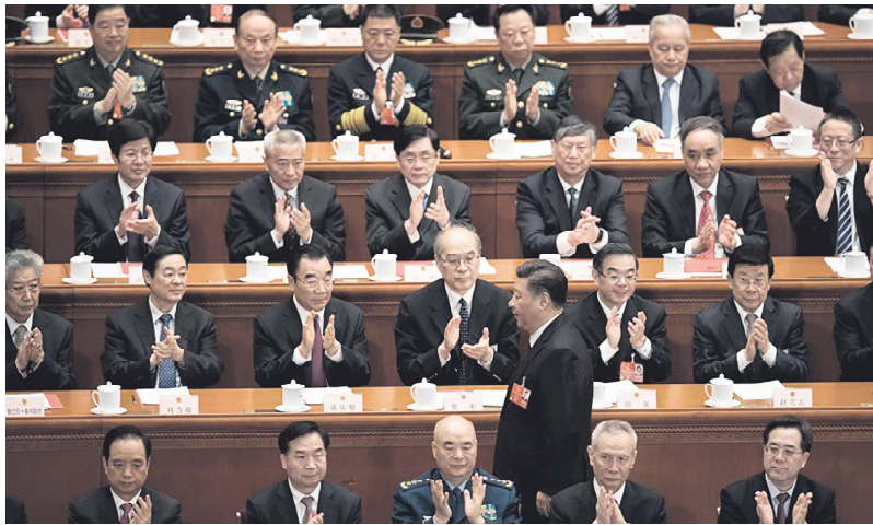
习近平与出席两会的官员。

危机。政治方面，二十大后，防长李尚福、外长秦刚被革职；至少有十多名军中将领及军工高层被罢职。经济方面，在以习近平为中心的中共中央全面接管下，中国经济疲乏乏力陷入严重困境，而当局却束手无策。