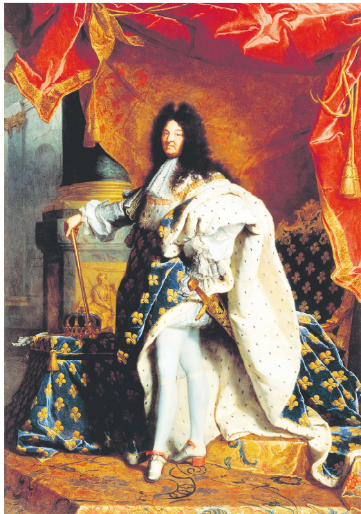
法兰西太阳王路易十四(画家亚森特·里戈,于1700年至1701年画作)

白晋在1697年3月抵达法国的布莱斯特港(Brest),一个月后得到路易十四国王的接见,并呈上来自中国皇帝的礼物,其中包括数十套供法兰西皇家图书馆(Bibliothèque