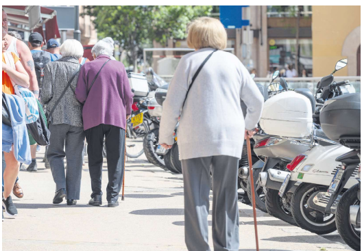
4月19日，西班牙马略卡岛，一老一少拄着拐杖步行。

和2019年(COVID前)相比，18个欧盟国家预期寿命增加，欧盟整体平均增长为0.2岁。罗马尼亚和立陶宛的预期寿命增加了1年和0.8