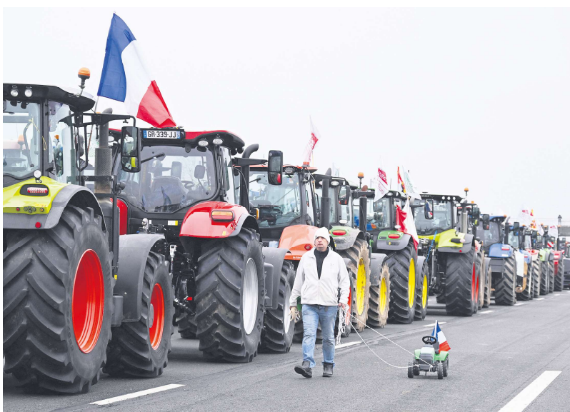
今年年初法国发生了全国范围的农民抗议活动。

这批新措施包括，承诺在5月初推出减少杀虫剂的Ecophyto最终计划（该计划因农业危机被搁置）、为农业提供新的现金流援助、加速100个储水和灌溉工程项目，以及对3个遭受气候危机打击的省份（东比利牛斯省、奥德省、埃罗省）的援助计划以及农业工作者退休改革等内容。