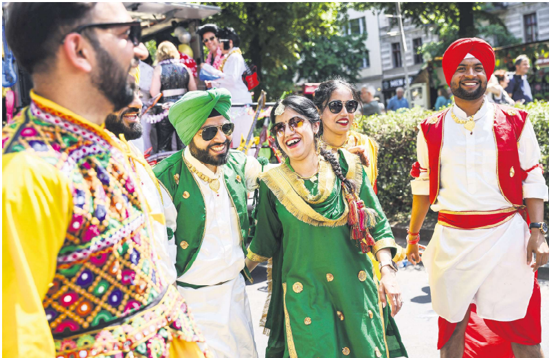
2023年6月28日，印度移民参加在柏林举行的年度文化嘉年华游行。

除欧盟蓝卡外，接受过学术培训的技术工人也可以获得居留许可，此种居留的先决条件是要有雇主的聘用意向，与蓝卡的不同之处是，没有最低工资限制，并且2023年11月德国颁布了新的移民法案，放宽了对就