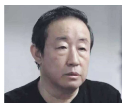
2023年1月7日晚，“政法虎”傅政华在电视上认罪。

傅政华当年倒台时，曾被称为前公安部副部长孙力军的“政治团伙”一案的主要成员，但是所谓“政治团伙”语焉不详，有分析指，这是一个整治高官的“兜兜罪”，只要高官们私底下靠近，就有被指为“结帮拉派”，搞“团团伙伙”的危险。习近平上台后，最担心的就是高官们私下通信信息，尤其对他视为“国之重器”的“刀把子”机构，比如司法部、政法委、公安部等等的高官，更担心他们有“不测之心”，这些都与习近平对自己的个