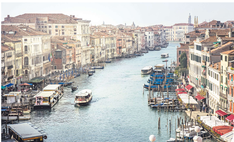
威尼斯大运河

4月25日是威尼斯开征“进城费”的首日。报导称，当日的操作并不顺利。虽然在一个交通枢纽车站，大多数一日游游客都准备好已付款的二维码供查证。但不少已订酒店