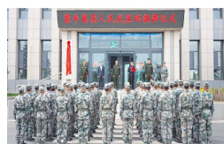
中国一家企业成立“人武部”。

观察人士分析认为，当局也知道目前银行系统坏账太多，漏洞已难弥补，有可能会变着法子通过储户存款填补，现在，它要提前准备对付有可能起来反抗的储户。