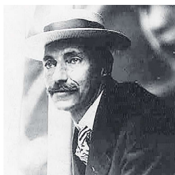
亚斯特(John Jacob Astor)拍摄于1909年。

1912年4月15日，泰坦尼克号在途中撞冰山后沉没，船上2,224名人员中有1,514人罹难。亚斯特是遇难者之一。他怀孕的妻子玛德琳幸