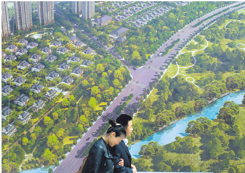
图为中国消费者路过一张巨幅房地产海报。

广东省城规院住房政策研究中心首席研究员李宇嘉称，“当前，二手房挂牌量、交易量都大于新房，而且二手房去化周期（即：销售周期）比新房更久，热点城市普遍在3年以上。另外，二手房价格跌幅度大于