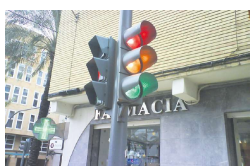
位于西班牙的交通信号灯

的实施，欧盟委员会的任务是创建一个在线门户，其中包含新规则、上诉选项和相关交通罚款等信息。欧