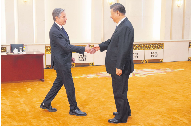
2024年4月26日北京，美国国务卿布林肯与习近平握手。