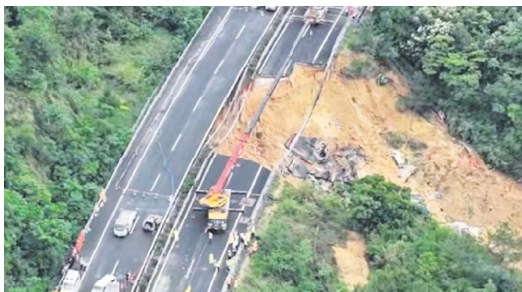
2024年5月1日广东省梅大高速坍塌事故现场

实际上，上述事故发生的前一周的4月24日，广东大潮高速的控股股东——广东交通实业投资有限公司党委书记、董事长蔡从华带队到广