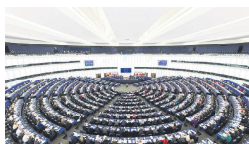
位于法国斯特拉斯堡的欧洲议会总部

格鲁克斯曼今年44岁，目前是欧洲议会议员。本次是他继2019年后，再次领导候选人名单参选。他的目标是制定一个以团结、生态和社会正义