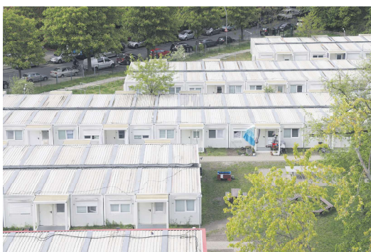
柏林一个为难民提供住房的集装箱定居点