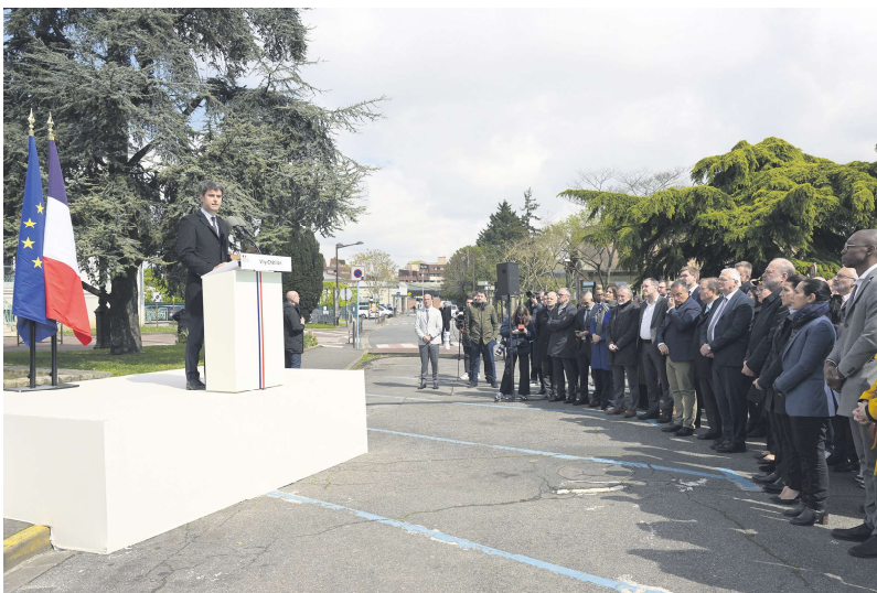
法国总理阿塔尔在维利-沙蒂永市讲话。

阿塔尔在讲话中列举了一系列数据：与一般人群相比，参与斗殴的青少年是一般人群的2倍。参与贩毒的青少年则是一般人群的4倍。参与持械抢劫的青少年更是一般人群的7倍。阿塔尔强调，法国需要从根本上解决问题，他还在讲话中给出了一系列解决问题的方向，并表示已要求政府各部立即开展工作，并在8周后给出具体方案。