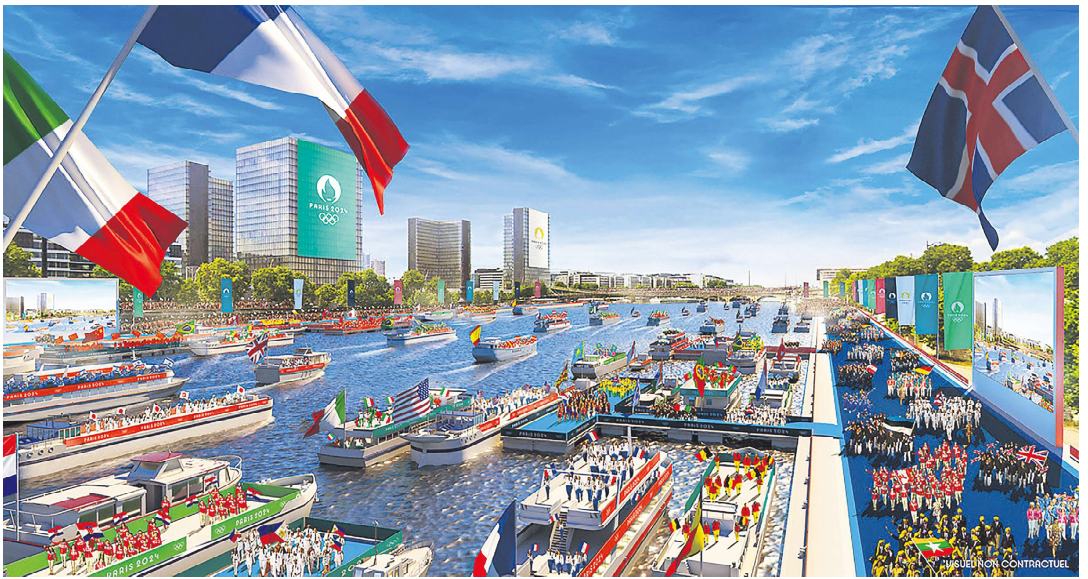
巴黎2024年奥运会开幕式的效果图

圣火接下来将在希腊各地进行为期11天的传递，之后于4月26日在泛雅典体育场，即1896年第一届现代奥运会的举办地正式移交给巴黎奥运会的组办方。次日，火炬将搭乘三艘“贝伦”号启程前往法国，于5月8日抵达马赛，预计将有多达15万人