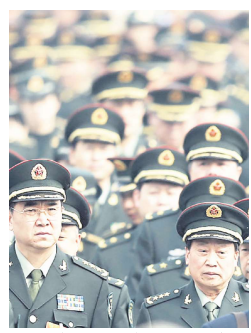
两会上的军方代表

信息支援部队成立的同时，习近平还宣布，撤销原战略支援部队番号，相应调整军事航天部队、网络空间部队领导管理关系。原战略支援部队司令员巨干生并未转任新成立的