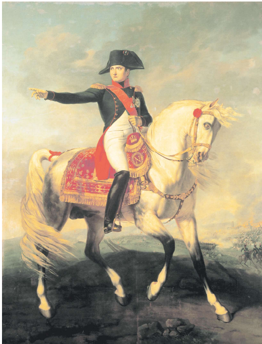
拿破仑在瓦格拉姆战场上(画家Joseph Chabard 于1810年所作)

自幼跟父亲约瑟夫学习中文的小德经(de Guignes fils)于18世纪末，跟随精通天文学的法国传教士罗广祥(Nicolas-Joseph Raux)来到中国。他在中国生活了十几年，直到得知其父亲离世后，才于1801年启程返回法国。后来成为了法兰西最早的汉学家之一，并先后当选法兰西科学院院士和法兰西文学院院长。