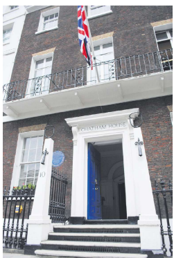
图为皇家国际事务研究所总部，也称伦敦智库查塔姆研究所。

陶敦指出，当前英国大学在人工智能、量子计算和其它前沿科技领域的研究，虽然位于技术创新的前端，