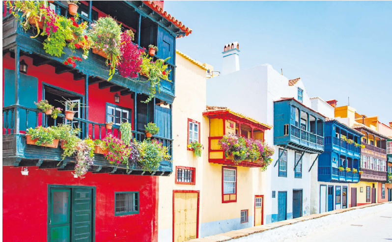
西班牙加那利群岛的典型住房

工作与生活的居民来说，几乎不可能找到一处像样的住房，而他们每天都在支付税收：“投机性的住房投资不是我们需要的国家模式，因为它会导致灾难。许多年轻人和家庭无法获得住房，这会导致不平等现象加剧。”