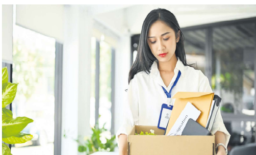
图为一名女子离开职场的示意图。