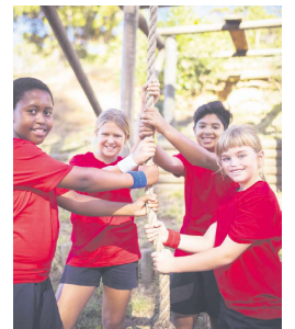
法国为11岁儿童推出假期营补助。

所有子女在2024年年满11岁的家庭都可以享受这一补助。据悉，该举措将涉及80%拥有11岁子女的家庭。在收入方面，根据政府相关网页