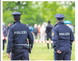
德国警察

据德国法律规定，为了获利而组织非法入境者，最高将可处15年监禁，因此这些嫌疑人接下来将会在监狱为自己的行为付出代价。