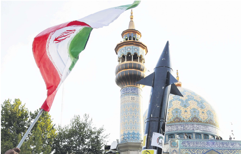
以色列于4月19日凌晨对伊朗一周前发动的导弹空袭进行回击。

4月19日凌晨，伊朗、伊拉克及叙利亚传出爆炸声。当地媒体称伊朗的一座机场以及2个空军基地附近发生爆炸。叙利亚南部亦受袭，一座雷