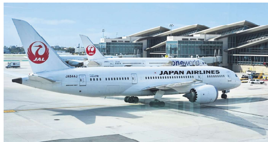
3月11日，一架日本航空公司的波音787客机停在洛杉矶机场。

关调查。萨利普尔在出席听证会的前夕接受NBC访问，被问及波音是否该停飞所有787梦幻客机，以进行检查时说，“就我所知，全世界的787机队都该注意，需要检查缝隙并确保不会发生故障。”