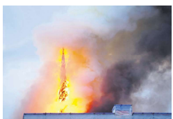
丹麦旧股票交易所于4月16日清晨7:30左右发生火灾。哥本哈根人说“这是巴黎圣母院焚为灰烬的再现”，丹麦人哭泣。