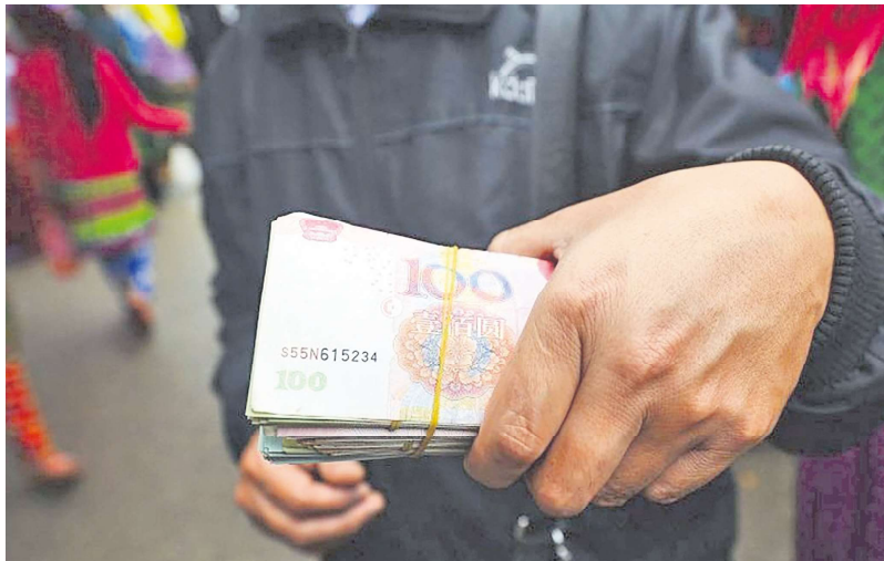
中国人民币

未在去年退休，导致今年的退休金被大幅度削减：“警察行业有内部政策，就是年满50多岁，但是工作年限达到30年以上就可以提前申请退休。有一个派出所警察，他2022年就符合这个政策，可以提前退休，他就说，我再干一年（警察），届时的退休金可以多领1000元，那时他退休金可以拿到九千多元至一万元。他就是多干一年，他退休只能拿到五千多元。”