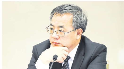
胡春华曾经是胡锦涛选定的隔代接班人。

伍德克说的密函，就是私密写给时任副总理胡春华的，信中表示：为实现清零目标而采取日益严格的措施，导致社会和经济成本正在迅速上