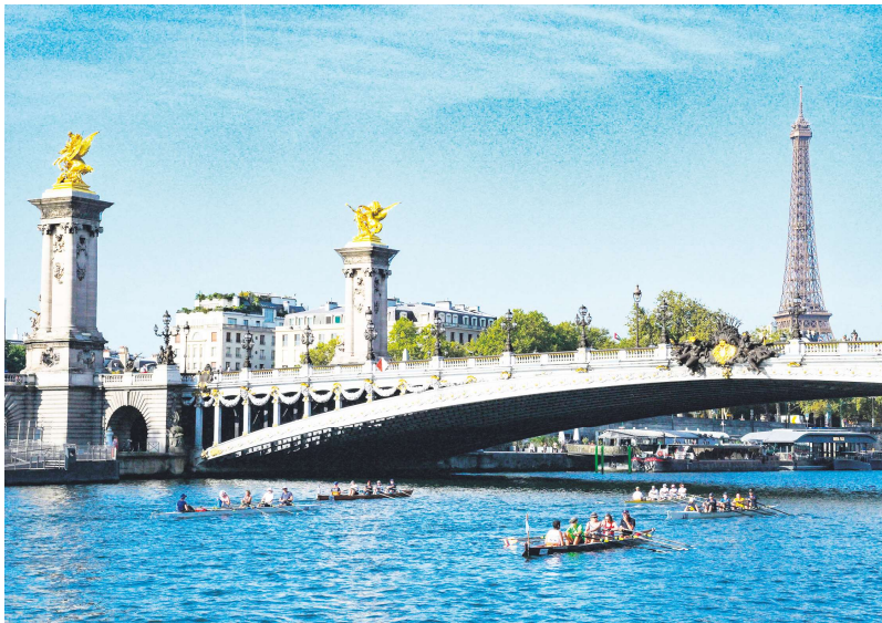
马克龙于四月中首次提及巴黎2024年奥运会开幕式的替补计划。

不过，马克龙同时指出塞纳河仍是开幕式的首选，并希望人们相信安全措施可以保证水上开幕式的正常进行。他说：“我们已提前做好准备，实施一个很大范围的安全圈，并对这里所有进出的人员进行筛查。沿着塞纳河的开幕式在世界上史无前例，我们能做到的也会做到。”