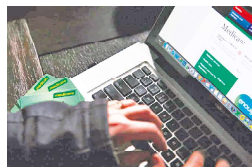
涉案的五名被告最终全部认罪。

英国检察官部门表示，这是英格兰和威尔士有史以来最大的福利欺诈案。五名被告于2021年5月5日首次被捕，警方查获了数百个装有伪造和虚假文件的“福利申请包”，以及900多件用于诈骗的电子文件。英国政府现在正对5名被告发起诉讼，试图追回被资金。