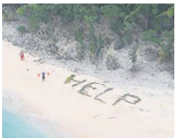
眼尖的美国海岸防卫队发现求救字样。

【本报讯】美国国会在近日就波音飞机的安全性举行听证会。吹哨人指控，波音公司在组装787梦幻客机(787 Dreamliners)和777客机时忽视品质和安全隐患。吹哨人受访时呼吁，全球需停飞所有787梦幻客机(787 Dreamliners)，进行全面检查，并发出警告，如果不解决存在的安全问题，飞机可能会在飞行中突然坠毁。