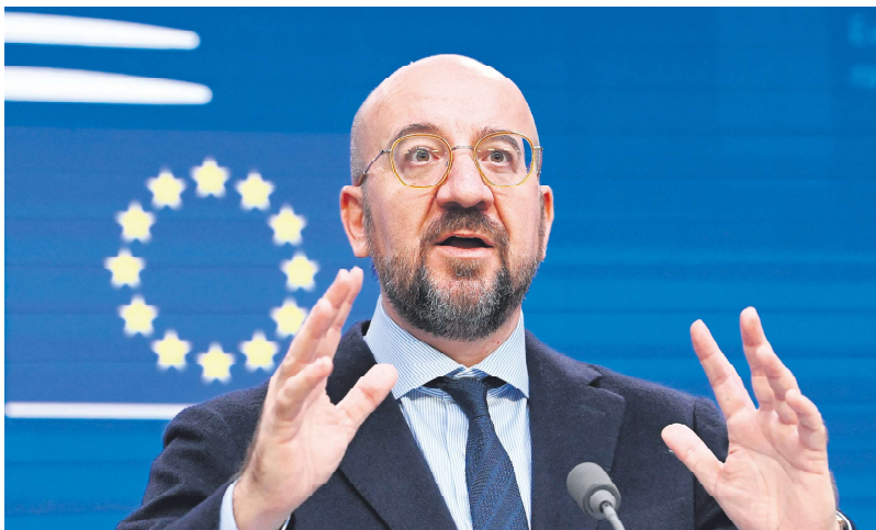
欧洲理事会主席米歇尔强调，必须调动更多资金、更多工具来投资战略领域。

冯德莱恩称，欧盟必须确保欧洲人不是简单的“其它地方生产的数字技术和服务的消费者”，并呼吁采取具体行动刺激资本获取、降低能源成本、解决熟练劳动力短缺问题并